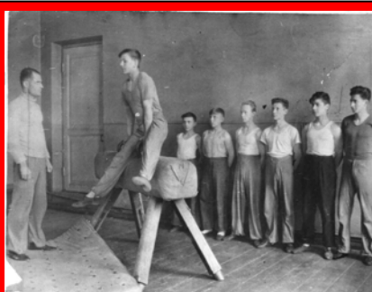
Тренировочное занятие спортивной гимнастикой юноши