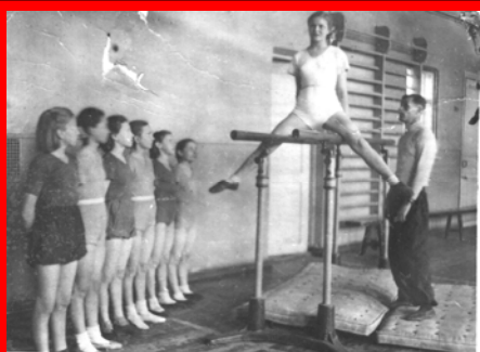
Тренировочное занятие спортивной гимнастикой девушки