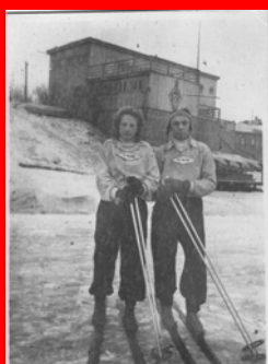
Отделение лыжные гонки

Школа росла, открывались новые отделения: гимнастика, легкая атлетика, конькобежный спорт. Менялись в школе директора и тренеры, в школу приходили новые дети. В 1945 г. численность воспитанников составляла 70 человек, 1948 г. – 221 человек, 1960 - 287 человек, 1970 г. – 500 человек, 2012 г. – 780 человек.