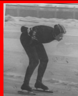
Отделение конькобежного спорта