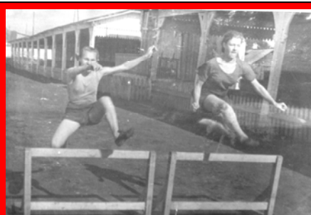
Отделение легкой атлетики